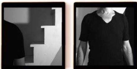
Silhouettes

En partenariat avec l'AJMI Jazz Club et le Théâtre des Carmes * Albert Camus, in « Cahier IV (janvier 1942-septembre 1945) » recueilli dans Carnets 1935-1948 [1942] © Éditions Gallimard